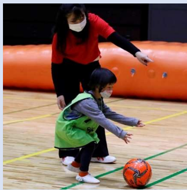
【軽度障がい児・健常児】